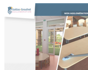
Retour expérimentation de bionettoyage à la vapeur dans les crèches