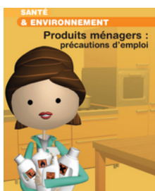
Livret sur les précautions à prendre lors de l'utilisation de produits ménagers