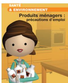
Livret sur les précautions à prendre lors de l'utilisation de produits ménagers