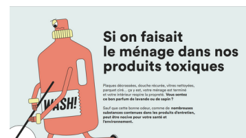
Infographie produits ménagers et leurs impacts