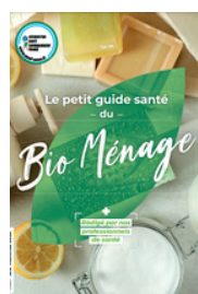
Guide du "bio-ménage"