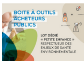
Boite à outils à destination des acheteurs publics pour créer un lot dédié à la "petite enfance" dans les marchés publics