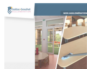
Retour expérimentation de bionettoyage à la vapeur dans les crèches